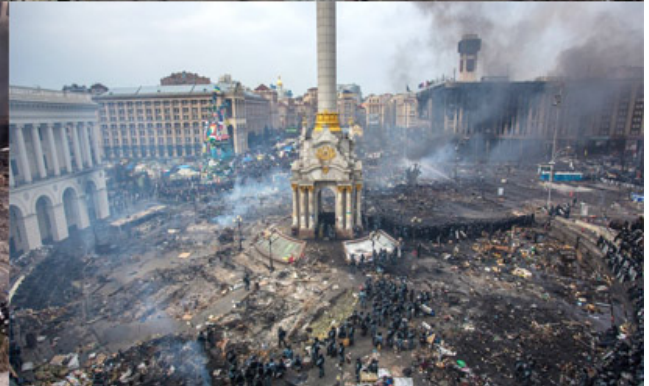
(صورة للميدان قبل وبعد الحرب )