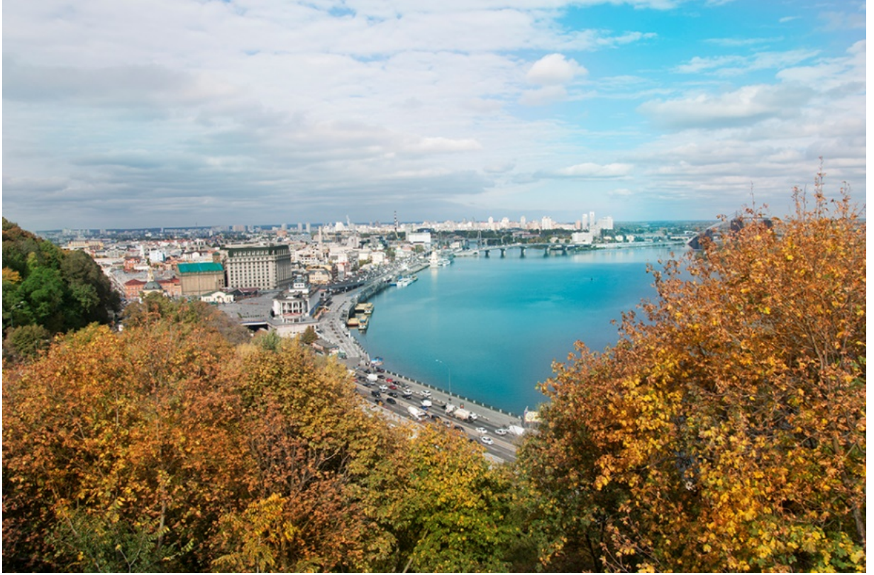
اطلاله علي المدينه من اعلي الجبل