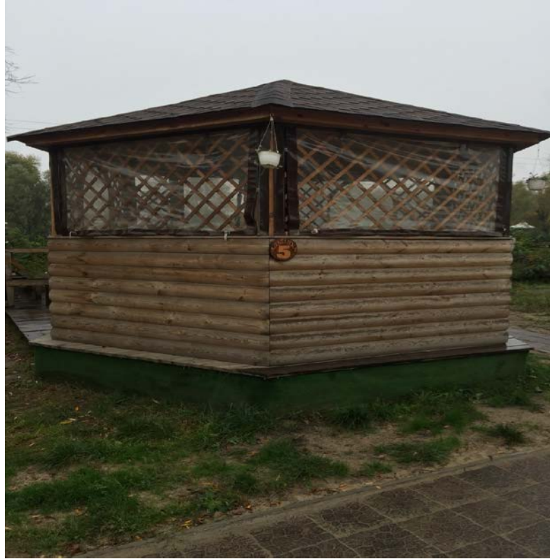
هذه الغرفة من الخلف رقمها ٥