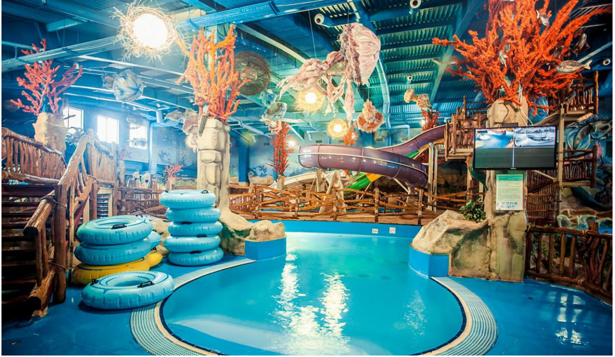
يوجد العاب مائية للاطفال داخل المجمع