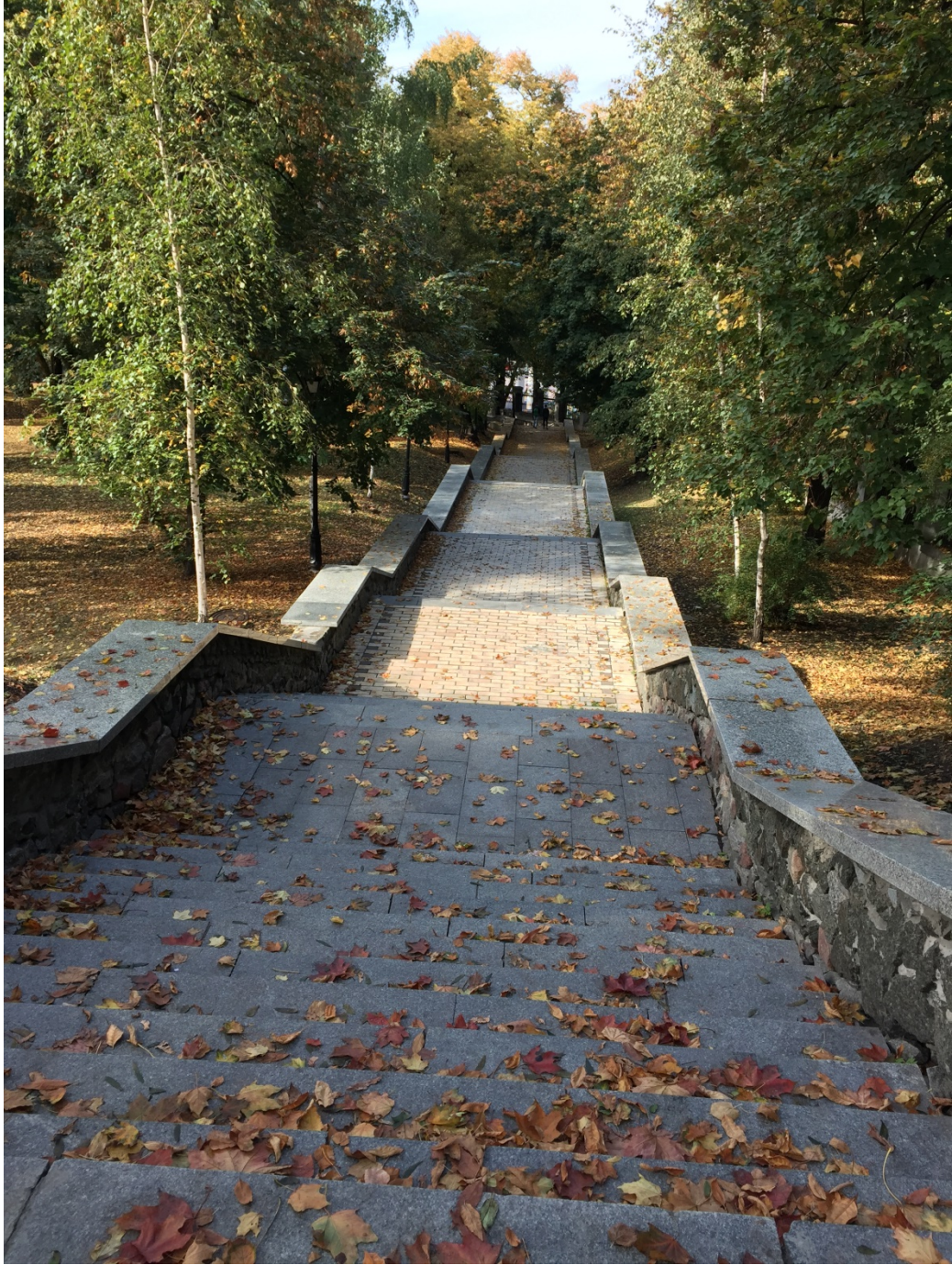
احد الممرات للمشبي بالحديقة في فصل الخريف