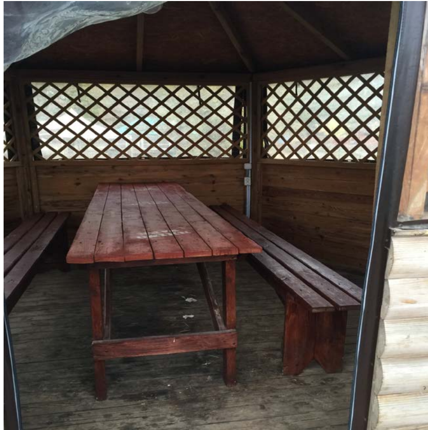
الغرفة من الداخل مجهزة بكراسي وطاولة