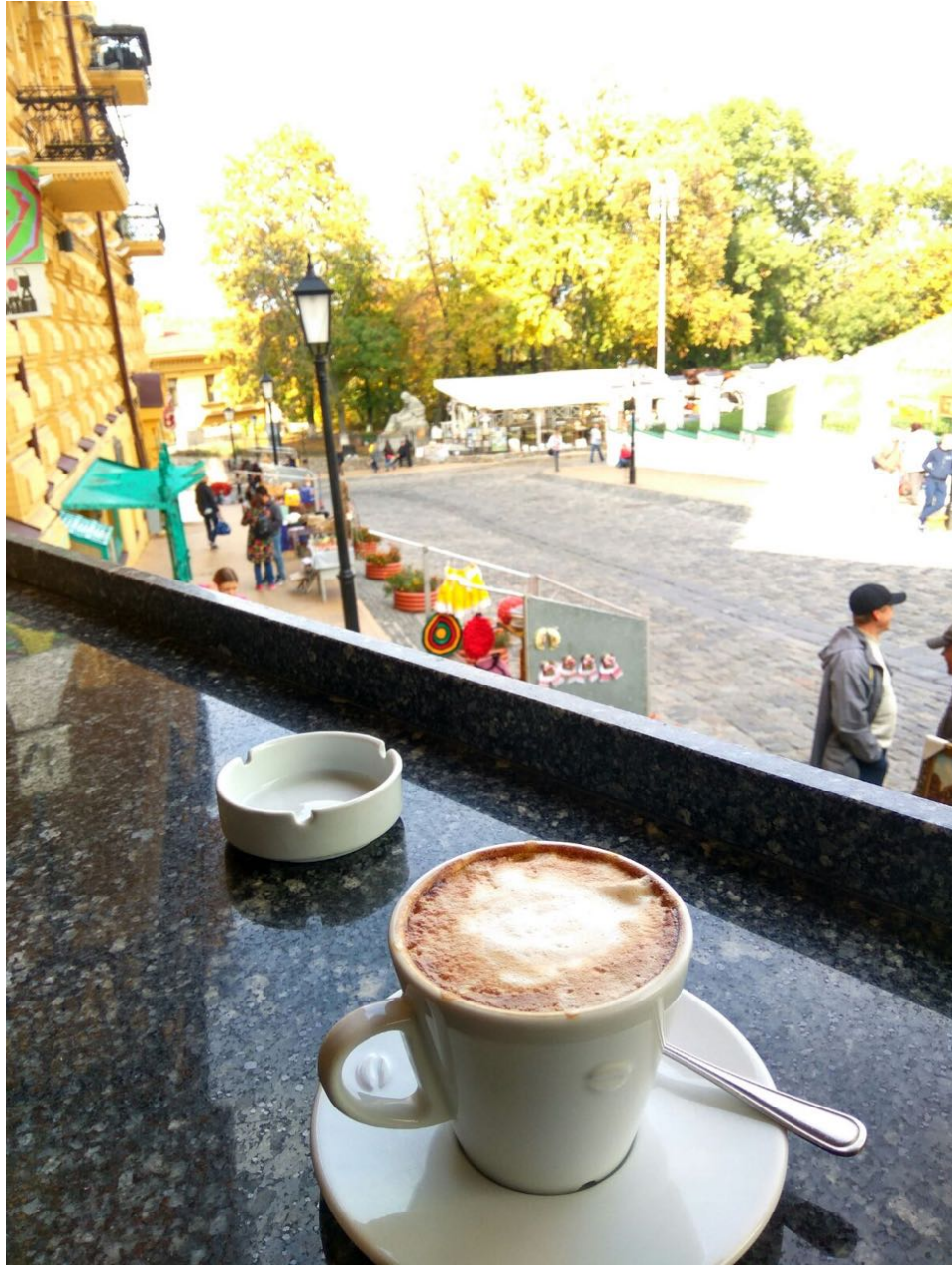
استراحة قصيرة في احد المقاهي المطلة علي المباني التراثية والسياحية