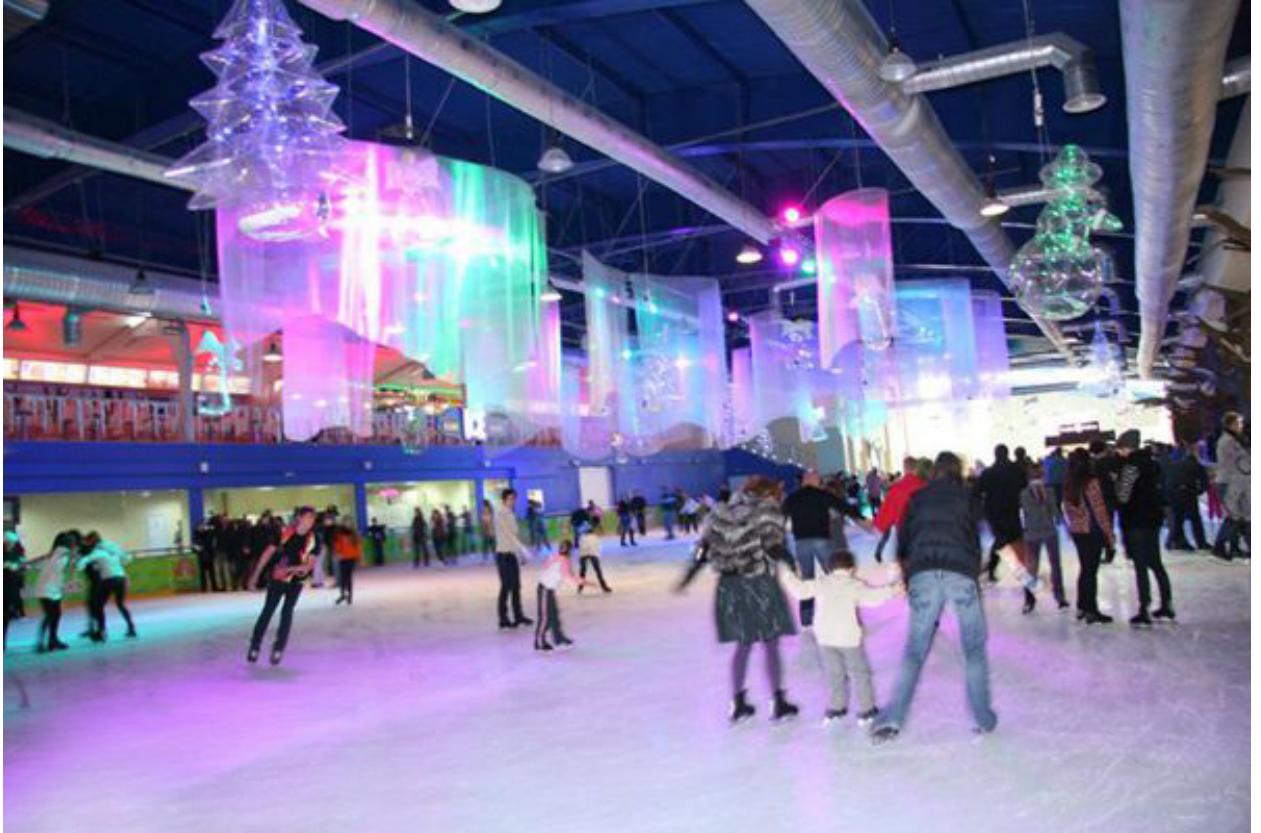
يوجد صالة تزلج